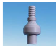
Rückschlagventil / non-return-valve 3004.02.00