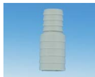
Schlauchstutzen / hose clip C1.0608.02