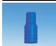
Entlüftungsstutzen / vent connection C1.0605.01