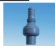
Rückschlagventil mit Entlüftung / non-return-valve with venting 3004.53.00