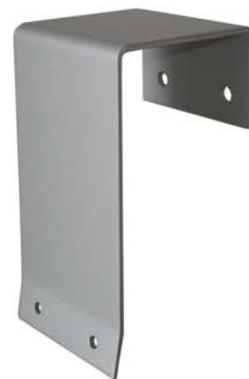
4 x Montagewinkel für Markisenadapter

Sehr geehrte Kundin, sehr geehrter Kunde,