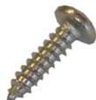
8 x Blechschraube 15mm